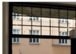
Ikkunateippausteos laajentaa näyttelyn kaupunkitilaan.

vät ne aikaan. Teosten nimet ovat peräisin Suomessa käytettyjen kalentereiden nimipäivistä ja vaihtuvat joka päivä.