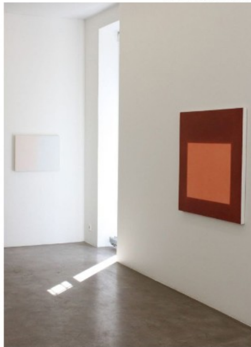
Näkymä Päivikki Alarähän näyttelystä. Teokset ovat valmistuneet 2019.